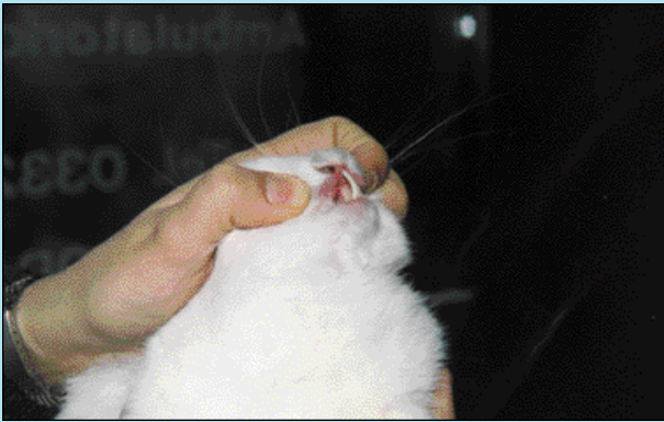
FIGURA 3 - Una errata alimentazione può provocare sia problemi fisici che comportamentali.

Considerati i notevoli cambiamenti di temperamento del coniglio nel periodo dell'accoppiamento, soprattutto il maschio ma anche la femmina, la sterilizzazione prima dei 4 mesi è assolutamente consigliata in entrambi i sessi. Particolarmente se ci sono bambini in casa - eventualità molto frequente perché il coniglietto è un pet molto amato dai bambini - la sterilizzazione è un precauzione doverosa soprattutto nei maschi che possono diventare mordaci o spruzzare urine. È sconsigliato tenere insieme due maschi o due femmine non sterilizzati, e altrettanto vale per un maschio e una femmina, a meno di non volere un numero altissimo di piccoli! (Gismondi, 1997, McBride, 1998).